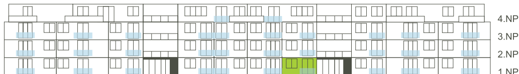
Východní pohled na dům/ Building View - East side