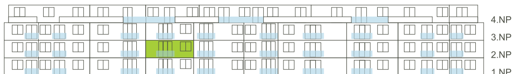
Západní pohled na dům/ Building View - West side