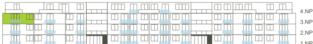
Východní pohled na dům/ Building View - East side