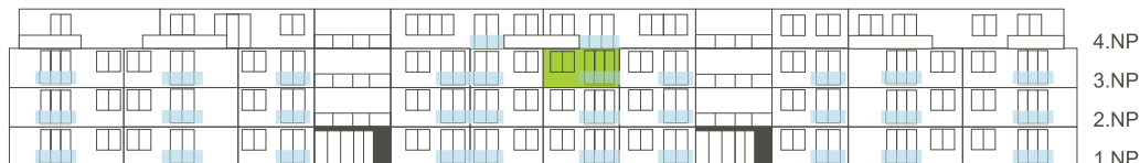
Východní pohled na dům/ Building View - East side