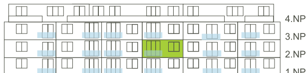
Západní pohled na dům/ Building View - West side