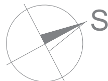
Půdorys podlaží/ Floor plan